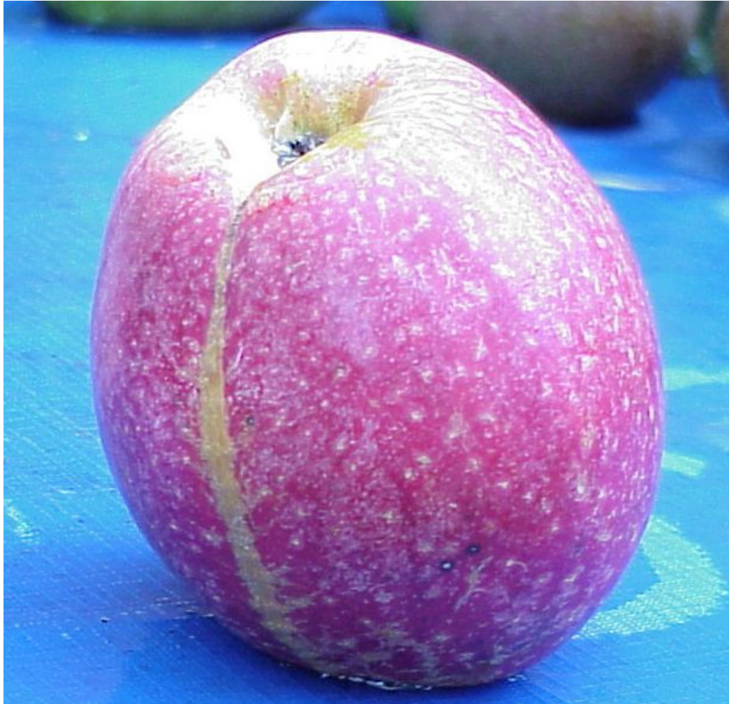
'Jopen' of 'Drentse Bellefleur'

Op advies van de overbuurman en kweker Broer Wouda werden later ook de rassen 'Bramley's Seedling' en 'Early Victoria' aangeplant. Dit bleken vreselijk zure appels te zijn, waarvoor je een kruiwagen vol suiker moest gebruiken om er een aanvaardbare appelmoes van te kunnen maken. Het beste product was de overheerlijke Appelgelei zoals moeder Dieuwke die maakte.